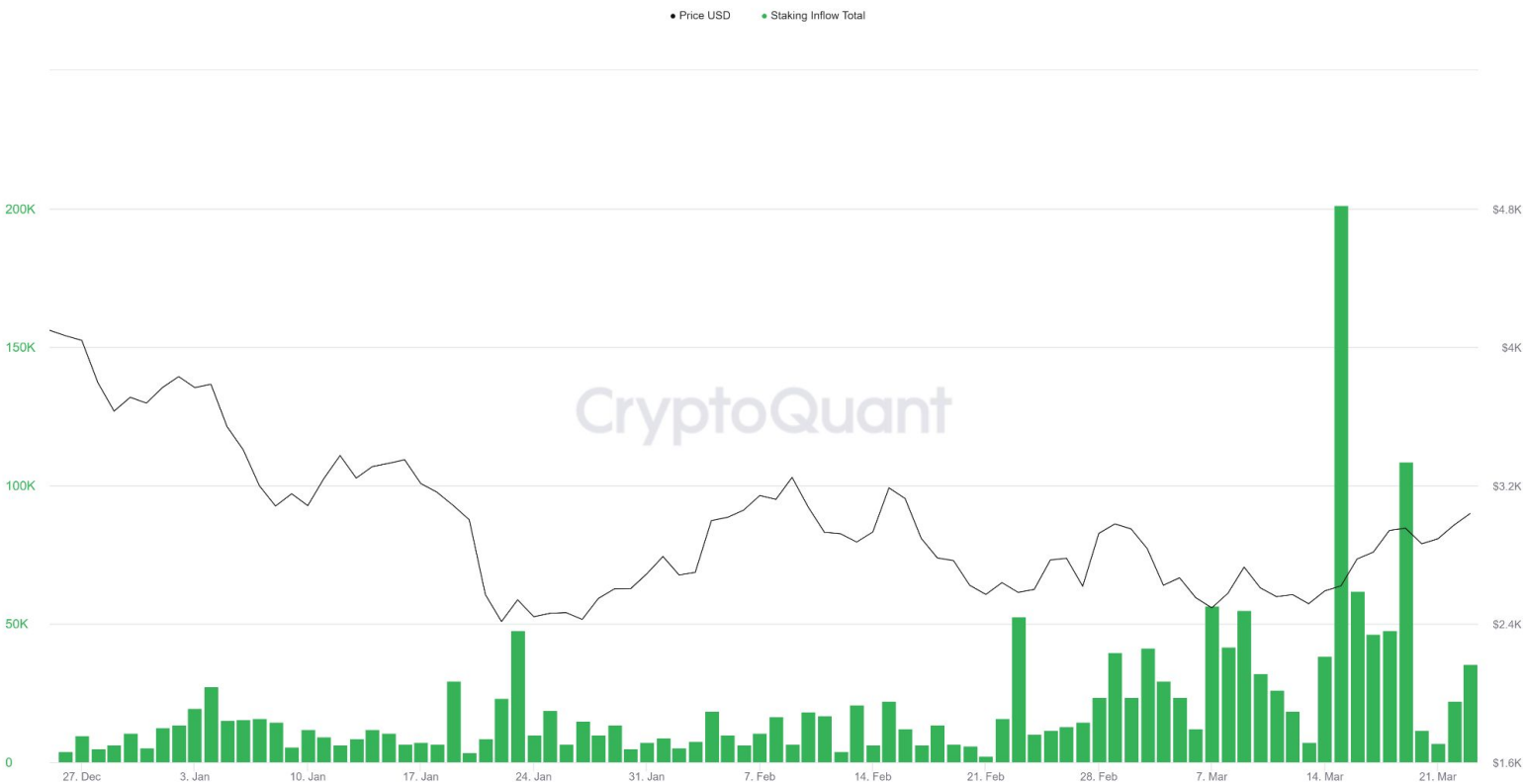
Ethereum: Staking Inflow Total