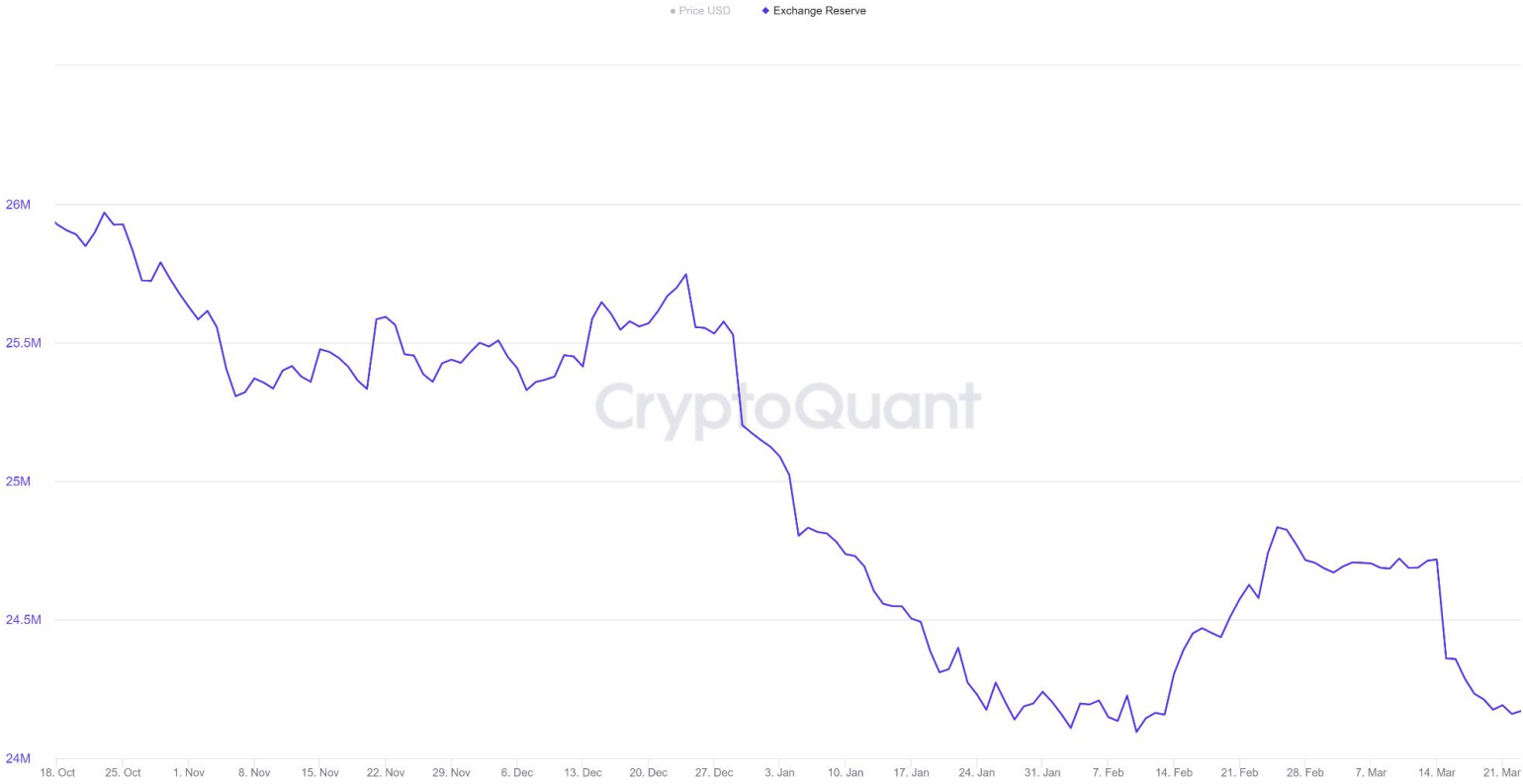
Ethereum: Exchange Reserve - All Exchanges