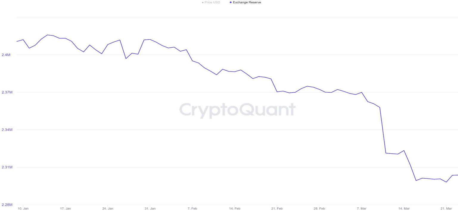
Bitcoin: Exchange Reserve - All Exchanges