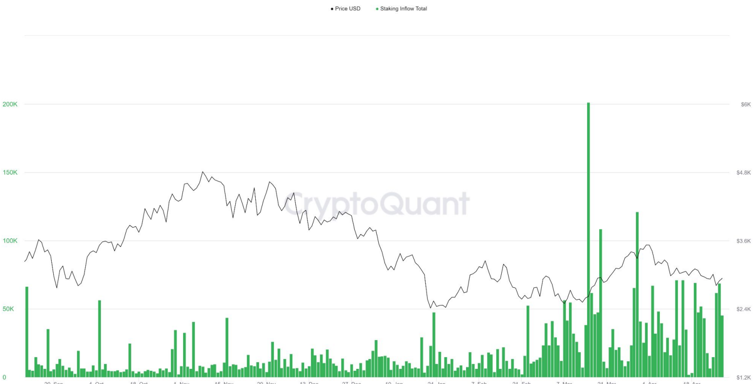
Ethereum: Staking Inflow Total