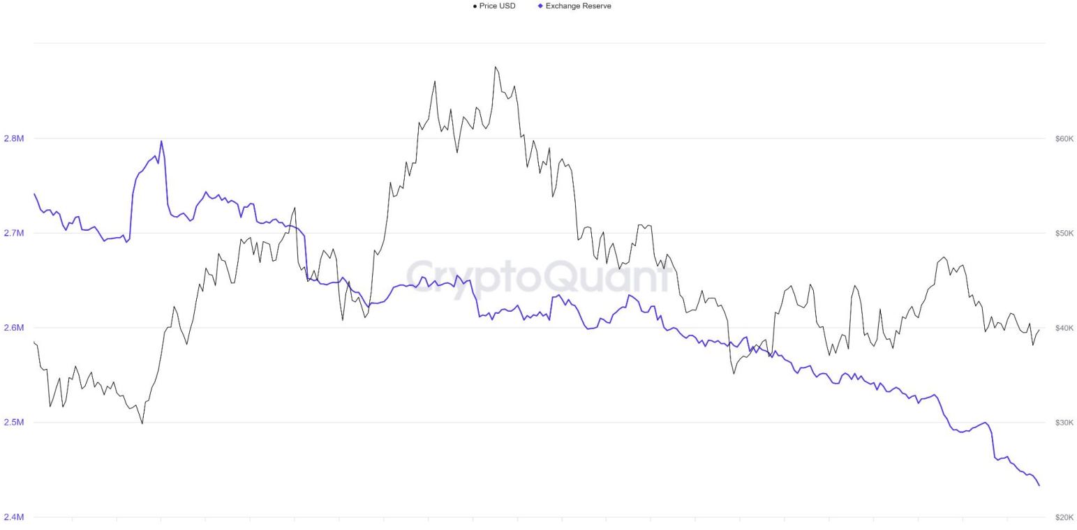
Bitcoin: Exchange Reserve - All Exchanges