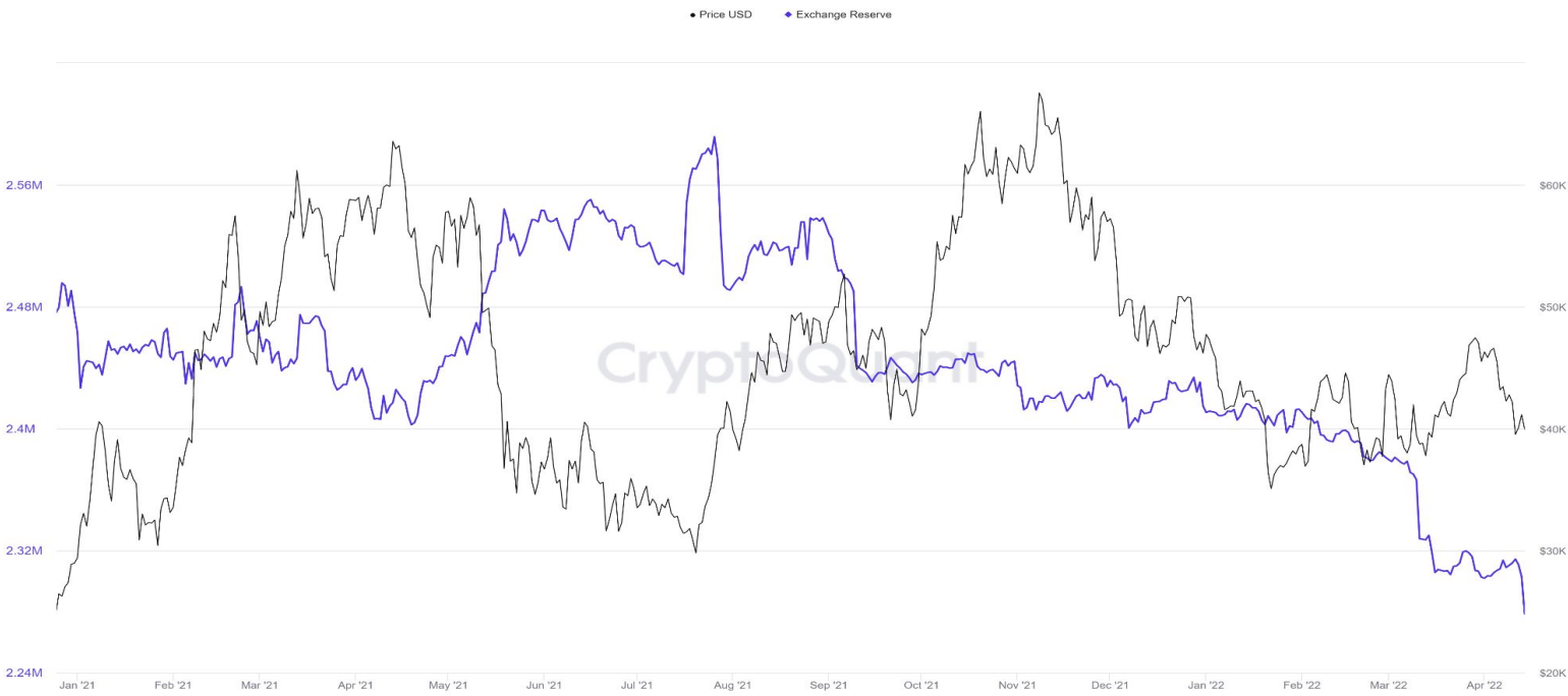
Bitcoin: Exchange Reserve - All Exchanges